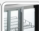
Portes coulissantes arrière